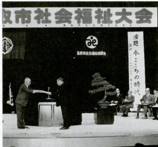
加藤・市社会福祉協議会副会長から表彰状を受ける受表彰者（12月1日、文化ホールで）

去年十二月一日、文化ホールで開いた市社会福祉大会で、社会福祉事業関係功労者十九人、一団体、五子供会と社会福祉事業関係協助人の皆さんに表彰状と感謝状を贈りました。また、在宅福祉奉仕者（長期障害者介護者）二人に褒賞状を贈呈。引き続き、新しく結成された下砂見地区子供会など四つの子供会へ「子供会旗」の贈呈も行いました。