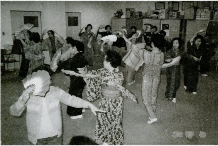
練習に励む、おどろグループの会員たち