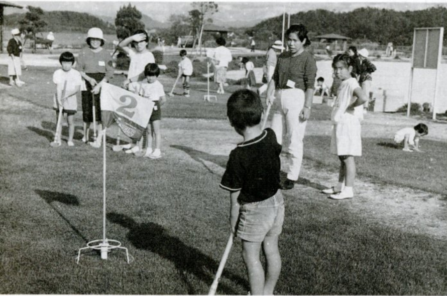
去年10月、大樹荘スポーツ広場で開かれた「ふれあい運動会」