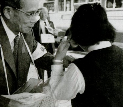
街頭で「赤い羽根」の募金を呼び掛ける西尾市長