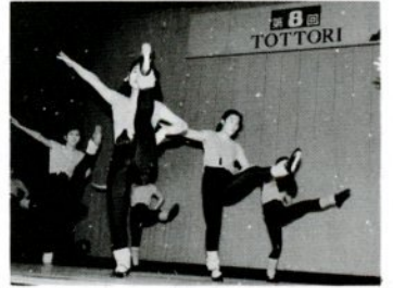
去年3月行われた青年芸術祭

青年芸術祭 19日、文化ホールで 第9回青年芸術祭を次の日程で開きます。ジャズ体操、バレエ、琴演奏などのほか華道の展示もあります。入場は無料。多数ご来場下さい。 とき 3月19日(日)午後1時~4時 ところ 文化ホール