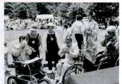
昨年、樽箱公園で開かれたふれあい広場