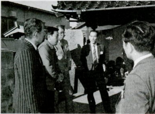
現地研修で差別の歴史を学ぶ (人切り地蔵の前で)

①行政機関など主催の講演会・研修会、部落解放研究集会(県・各市)、全国的規模の各種研究大会に参加 ②四社合同同和問題連絡会(年