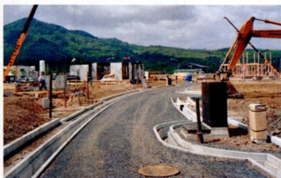
▲分譲に向け進められている住宅建築工事(つのいニュータウン)