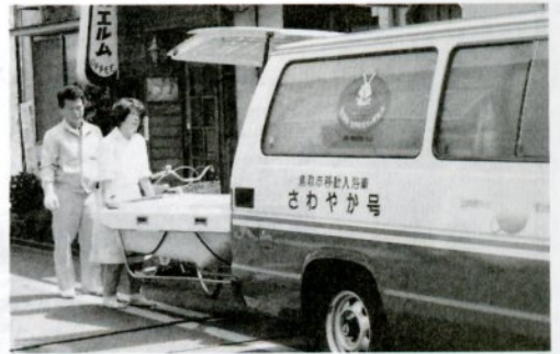
毎日フル回転の移動入浴車さわやか号

家にふろがないので、元気などは白砂荘のふろに入りに行っていました。四カ月入院したため動けなくなり、去年の五月から入浴サービスを受けています。ふろ好きなのでその日が待ち遠しく、ありがたく思っています。ぜひたくを言うようですが、もう少し回数を増やせてもらえたら、と妻と話すこともあります。