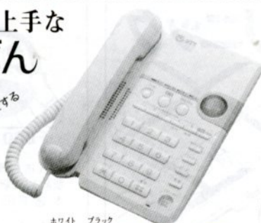
より白 ブラック (WH) (BK) 価格27,800円(消費税別)