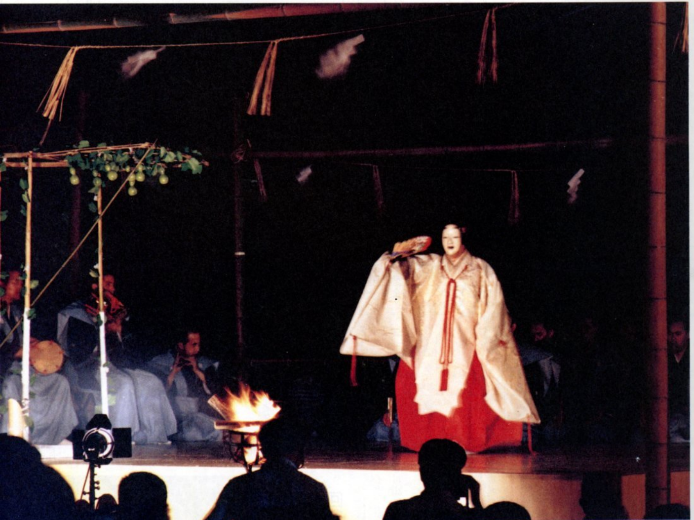
昭和52年7月 樽路公園で催された「鳥取薪能」