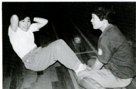
腹筋運動でシェイプアップ

おなかのトレーニング法はいろいろありますが、代表的なものといえば、何とんでも上体起こし運動——いわゆる腹筋運動でしょう。（英語での正式名は「Sit up」シット・アップ。直訳は起き上がる。洋の東西を問わず感覚は似ていますね）