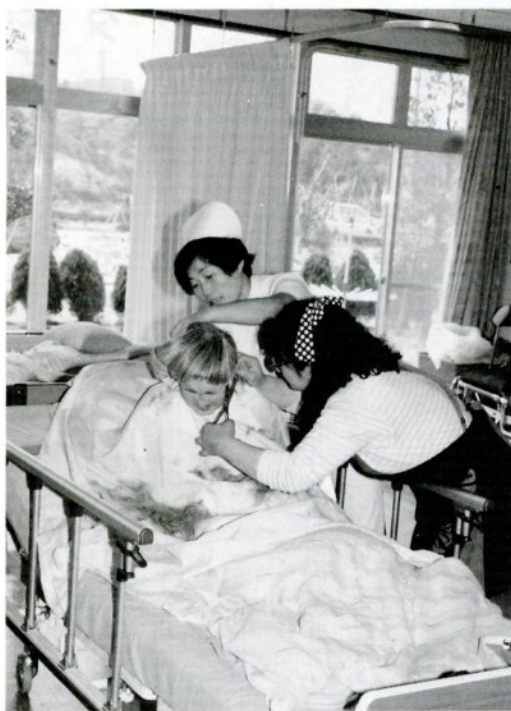
あすなるデイ・サービスセンターで寮母に散髪をしてもらうお年寄り

この事業は昭和六十一年十月に開始しましたが、なかなか好評で順調に利用者が増えています。そのため、今年度から送迎用バスを二台から三台に増やし、一日に十二人が利用できるようになりました。利用料金は、一回一人五百円です。