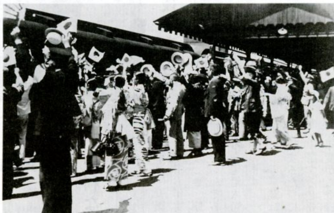
鳥取駅で出征兵士を見送る人たち(昭和12年8月)

を結んだし、中には五銭や十銭を縫い込んだりした。「死戦・苦戦を超える」語呂合わせだが、大まじめであった。そのころであろうか、毎夜、