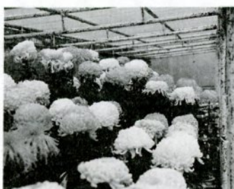
力作を菊花展に出品 (63年11月)

鳥取秋芳会は、市制百周年事業の一環として「菊作り講習会」を次の日程で開催します。菊作りに興味のある人な