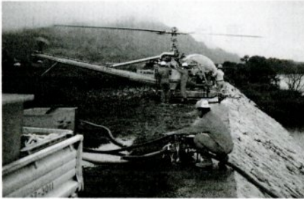
防除剤の積み込み作業

賀露、湖山、末恒地区で栽 培している六十三三年産の葉 タバコに「黄斑えそ病」が発 生し、大きな被害を受けたタ バコ畑もありました。この「 黄斑えそ病」は、バレイシヨ の「黄斑えそ病」から葉タバ コを守るため「市たばこ黄斑 えそ病対策協議会」を設置し て防除対策を行っています。 砂丘畑でバレイシヨを栽培し ている皆さんの協力がなくて は被害防止の効果が上がりま せん。次のことについて協力 をお願いします。 ①バレイシヨは、掘り残し のないようにすべて収穫して 下さい。 ②収穫したバレイシヨは畑 の周辺に放置しないで、すべ て持ち帰して下さい。また、 バレイシヨの葉にもウィルス を持っているので、葉や茎 は埋め込むなどして放置しな いで下さい。