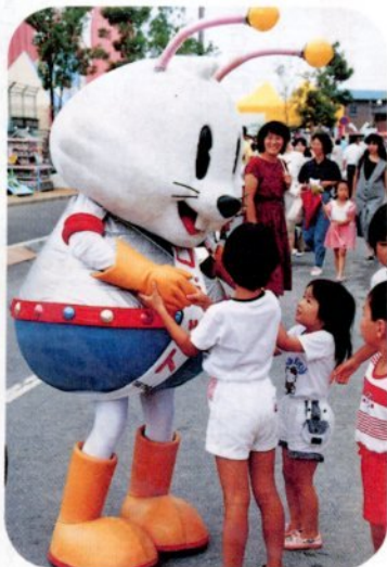
どこでもロビット君は人気もの