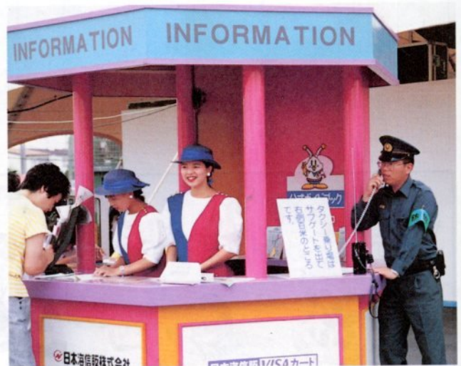
大切にしました笑顔の応対