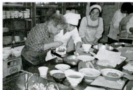
調理実習をする参加者たち

市立病院は、次の日程で糖 尿食の料理講習会を開きます。 費用は1人500円。申し込み は午後1時～4時に同病院 内科外来(☎23-6211)へ。 先着20人で締め切ります。