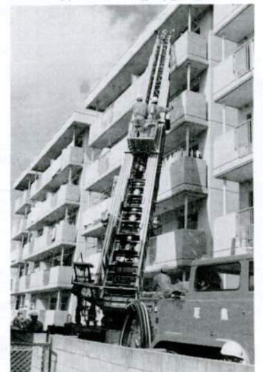
高層ビルの救助訓練(県営住宅興南団地で)

場では、防災会の主婦らによる建物と油の火災の初期消火訓練、明徳地区住民による避難訓練、自動車火災訓練、医療救護訓練などが実施されました。