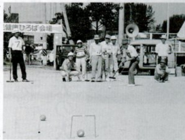
健康ひろばのゲートボール(美保公園多目的広場で)