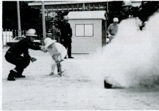
消防士が消火器の使い方を指導(久松小で)

昭和十八年の鳥取大地震から四十六年目の九月十日、午前十時から正午までの二時間、市総合防災訓練を実施しました。会場となった市民スポーツ広場や久松小学校、県営住宅興南団地、各防災会で訓練に参加した約三千人の市民は、避難誘導、初期消火、救急などの訓練にてきはきと取り組んでいました。