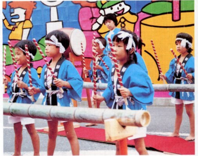
竹太鼓を演じる神戸、東郷両児童館の子供たち