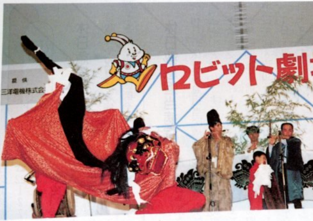
ロビット劇場で麒麟獅子の踊りを披露