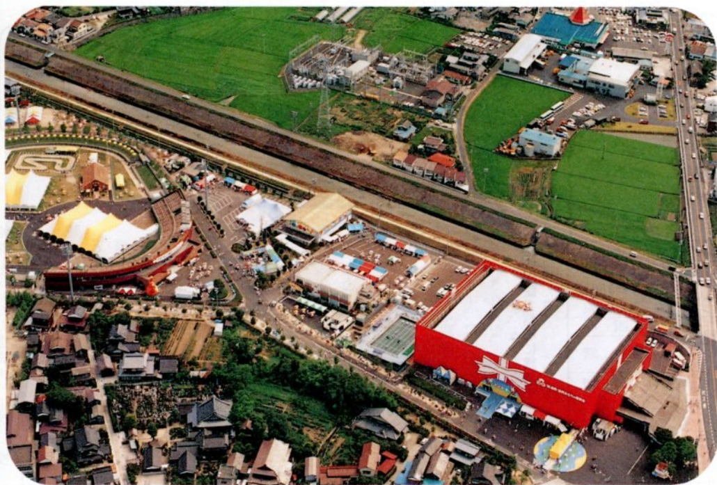
おもちゃ博の会場となった市民体育館と美保球場