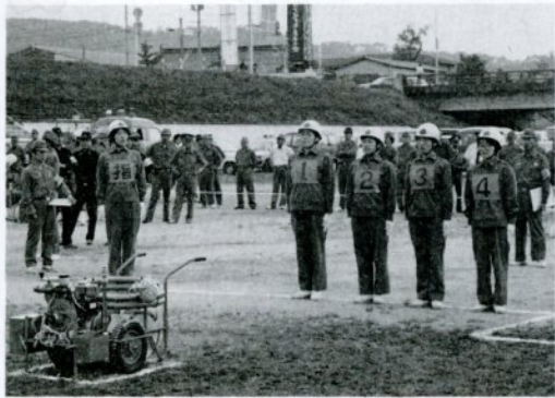
県代表として全国大会に出場した大路婦人消防隊

この訓練は、昭和十八年の鳥取大地震と同じ規模の震度六(マグニチュード七・四)の地震が午前