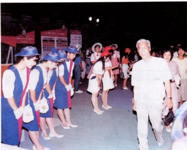
最後までたくさんの人でにぎわったおもちゃ博