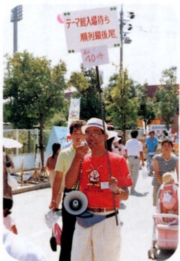
ハンドマイクで誘導する係員