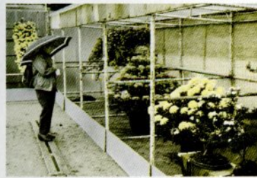
去年の菊花展(久松公園で)

のポイントをまとめた小冊子を差し上げます。 とき 10月6日(金)午後1時30分～4時 ところ 福祉文化会館5階