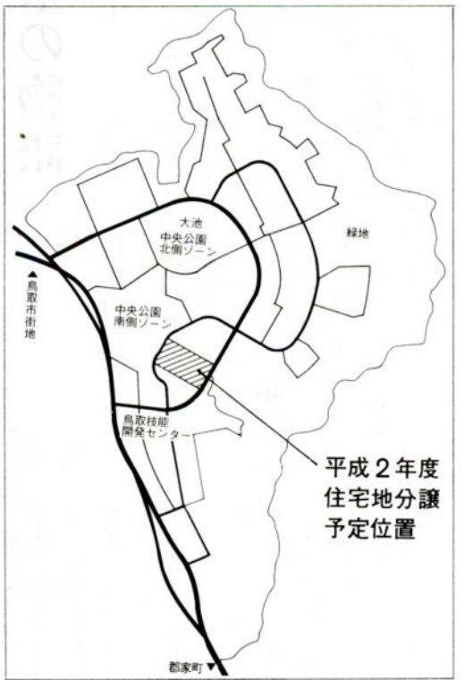
平成2年度住宅地分譲予定位置

若桜町の岩屋堂に住んでいましたが、屋敷の一部が国道として買収されたり、孫が生まれ部屋が手狭になったのを機に「ニュータウン」に移転。ふるさとの若桜町に近いということも気に入りました。三世代の家族が住むには適当な広さで、引越して良かったと思つて、話し合っているところ