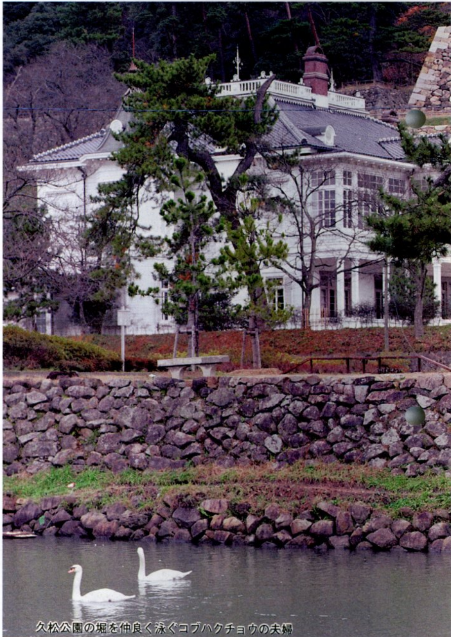
久松公園の堀を仲良く泳ぐコブハクチョウの夫婦