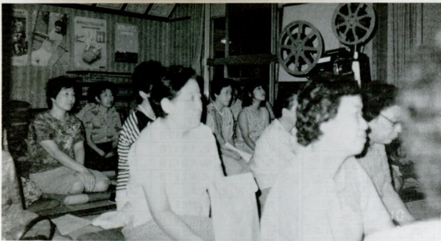
遷喬地区婦人教室で同和問題を研修する参加者たち