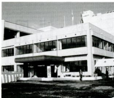
完成した勤労者総合福祉センター