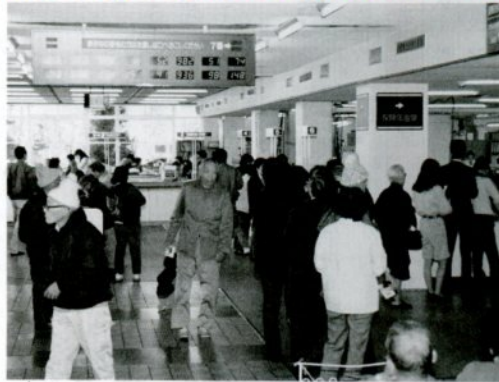
年度末が近づき混み合う市役所1階窓口