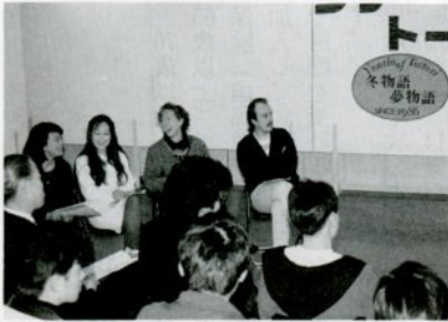
外国青年を交えてのフリートーク

青年教室交流会実行委員会は、市内の青年同士の交流と親しくを深めるため、次の日程で「青年教室交流会」を開きます。