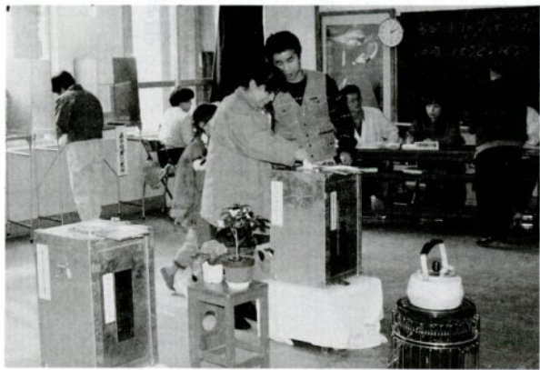
意中の候補に1票を投じる有権者(2月18日、西中で)

投票日の当日、投票区域外で仕事に従事したり、そのほかやむを得ない用務で市外へ旅行したり、病氣、妊娠などで自ら投票所へ行けないときは、不在者投票をすることになります。また、指定病院などに入院している人は、その病院で不在者投票ができます。なお、障害者手帳・戦傷病者手帳の交付を受けている人のうち、郵便投票証明書の交付を受けている人は、4月11日(水)まで不在者投票の請求をして、自宅不在者投票をすることができません。不在者投票のできる期間は、4月8日(日)～14日(土)で、毎日午前8時30分～午後5時です。場所は市役所第二庁舎5階第二会議室です。印鑑を必ず持参して下さい。