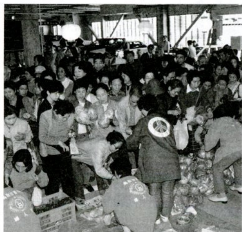
にぎわう本通パーキングのふれあい市

生産者と消費者の交流を図ろうと、「松保百円市」など新しいむらづくり運動「アフトピア・トットリ21」で生まれた「ふれあい市」が、市内12カ所で開かれています。「ふれあい市」では、減農薬で栽培した新鮮な野菜や、手作り加工品を提供。ふれあい市連絡協議会は、市民の皆さんに「ふれあい市」の利用を呼びかけています。