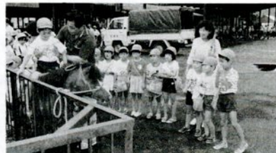
畜産共進会の「ふれあい広場」で動物と遊ぶ倉田保育所の園児たち