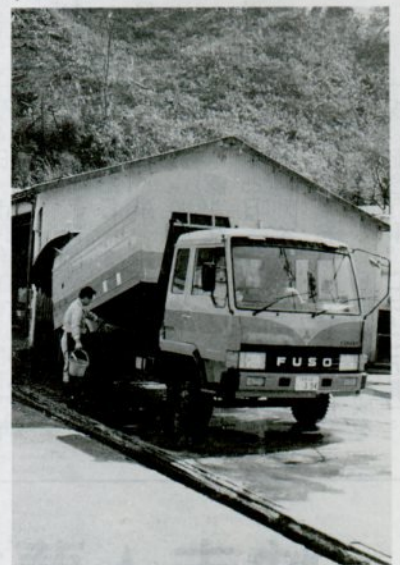
ごみ収集車を新しく購入予定(同型式の収集車)