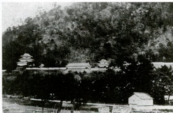
明治初期の鳥取城（明治12年に解体されたという）