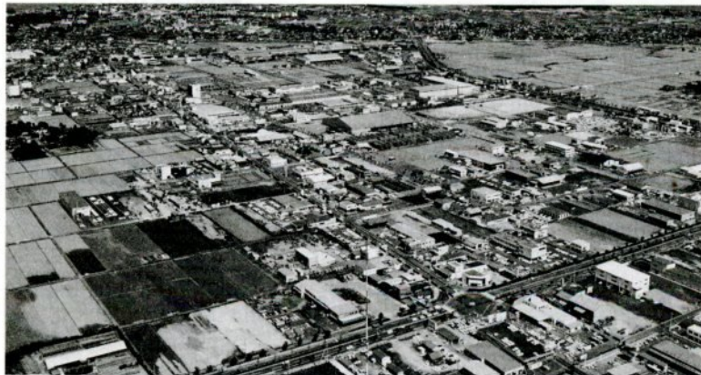
千代水土地区画整理事業で約107軒を整備