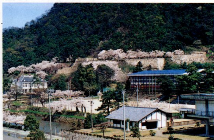
現在は早朝登山に利用されたり、桜の季節には花見客でにぎわっています。