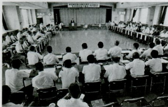
部落解放基本法の制定を求めて 総会を開催

水平社創立から部落解放同盟と改組されるまでの間を、糾弾闘争主導の時代。それから「地对財特法」成立までの間を、行政闘争主導の時代。これからの運動を平和・人権・民主主義を基軸とした国内外での共同闘争主導の時代、と位置づけています。