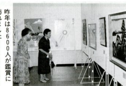
昨年は8600人が鑑賞に訪れました

対象は、小学1、2年生と保護者です。おこなう日、教材費、定員は左表のとおりです。