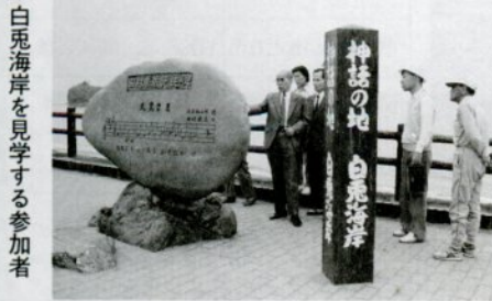
白兎海岸を見学する参加者

【講習期間】点訳 毎週木曜日、午前10時～11時30分 朗読 毎週第1、第3木曜日、午前10時～11時30分(費用資料代400円)