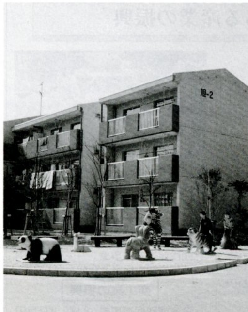
公営住宅建て替え事業で昨年7月完成した市営住宅旭町団地