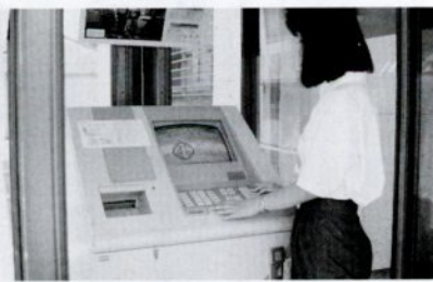
気軽にご利用下さい。公衆端末