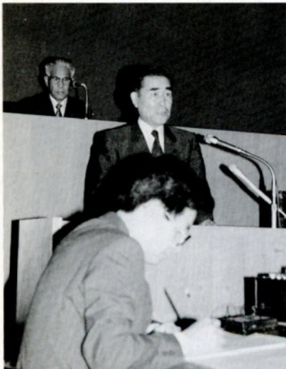
6月定例市議会で提案説明を行う西尾市長

〔二八二万円〕の導入について整備計画を策定 〔九〇〇万円〕 ▽安蔵公園の維持管理 コート、遊具広場などの維持管理を公園協会に委託 〔四四七万円〕 ▽ごみの減量化対策事業 団体の古紙回収に助成金 〔一九七万円〕 ▽観光ビデオの作成 物産展や各種大会などで放映 〔四三〇万円〕 ▽水田農業活性化対策事業 良田地区にモデル型水田営農集団育成事業を導入 〔七七五万円〕 ▽転作田条件整備促進事業 湿田の乾田化を図り、集団転作を促進 〔二〇〇〇万円〕 (次ページへ)