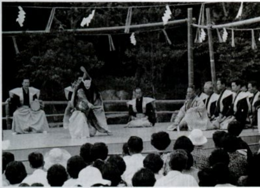
樗谿公園で催された「鳥取薪能」(昭和52年7月)

前売り券は大人が2000円(当日2500円)、高校生以下は1000円(当日同額)です。販売は市社会教育課、丸福レコード商会、アコヤ楽器店の各所です。お早めにお買い求め下さい。