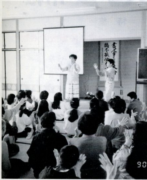
3月・岩倉地区公民館で開かれた「地域ぐるみ交流会」

市社会福祉協議会は三月二十七日、評議員会を福祉文化会館で開き、平成二年度事業計画と一般会計、特別会計収入支出予算の承認を受けました。 今年度の重点施策は、次のとおりです。 社会福祉をめぐる課題は、本格的な高齢化時代を迎えて、ますます増大し、しかも複雑多岐の傾向となっております。 国をはじめ、地方自治体においても「高齢者保健福祉推進十年戦略」事業等も導入され福祉再編へと大きく動き始めました。 これからの社会福祉活動の在りかたとしては、身近な地域、在宅福祉活動への展開が強調されています。 こうした情勢の中で、本会は「地域福祉」「在宅福祉」の推進に当たって、中核的役割を担いながら、行政関係機関、公私の各種社会福祉団体等との連携協調を十分はかり、理解と協力を得て、さらに、きめこまかな各種の社会福祉事業活動をより積極的に展開し、本市の福祉事業の増進をはかっています。 各事業の予算は、別表のとおりです。