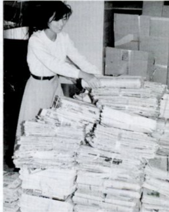
古紙回収で資源の再利用

す。この排水設備工事に伴う皆さんの負担が少しでも軽くなるように「水洗便所改造資金貸付制度」を設けていますので、ご利用下さい。貸付金額などは、次のとおりです。 貸付金額 10万円～50万円 利息 年2.5% 償還 50カ月以内月賦償還 問い合わせ、申し込みは下環境部管理課(☎市役所内線384)へ。