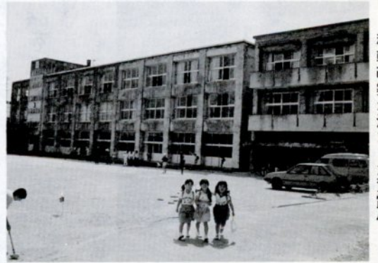
移転改築が決まった賀露小

▽農業構造改善事業||津ノ井西地区に農畜産物処理加工施設の建設や津ノ井東地区の集落道整備事業など (一億七〇三万円) ▽農業集落排水事業||三山口、赤子田、東郷地区(北村、西今在家、篠坂)で実施 (二億六二〇万円) ▽水田転用果樹団地造成調査研究 (二五五万円)