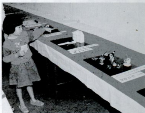
工芸菓子に見入る女の子

お菓子が因幡地方の風物や伝説などを表現する「工芸菓子展」が次の日程で開かれます。とき〓10月13日(土)午前9時～午後5時▷14日(日)午前9時～午後4時 ところ〓福祉文化会館 問い合わせは、市菓子製造組合(☎22-2402・玉田やさん)へ。