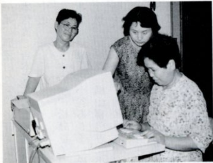
IBM寄贈のパソコンによる点訳作業

鳥取農業高等学校美和分校では 知識偏重と自己中心的な考えに陥 りやすい風潮の生徒に、感謝と思 いやりの心を育てるために、昭和 51年から教育の場にボランティア 活動を取り入れて積極的に取り組 んでいる。