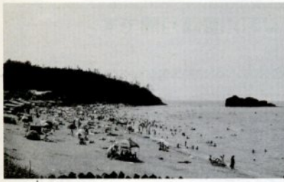
多くの海水浴客でにぎわう白兔海岸

名所、旧跡の記念スタンプを五カ所以上集めて下さい。毎日、先着十五人に「いか胤」か「流しびな」のお土産を差し上げます。スタンプ帳とプレゼントは、鳥取駅構内の観光案内所で発行。 期間は七月十四日(土)から十一