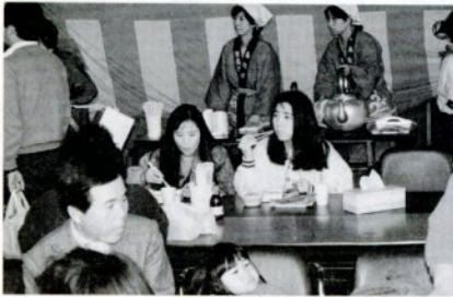
賀露みなとカニ祭りで舌鼓

とれたての海産物を賞味する「賀露みなとカニ祭」を11月17日(土)午前10時～午後3時、賀露港で行います。「海産物直売」「味わい」「カニスキ」