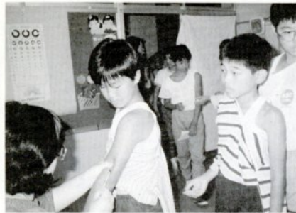
予防接種を受ける児童たち

受けてはいけない人 熱があったり、病気がかかっている人、心臓、じん臓、肝臓に異常のある人、妊産婦、病後の衰弱者、そのほか医師が不適当と認めた人、特に鶏卵に対する特異体質の人は接種できません。