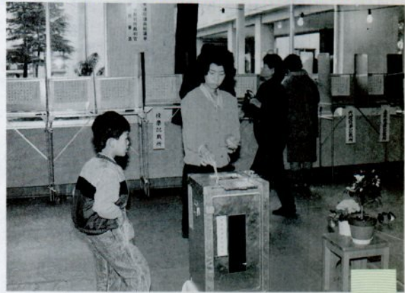
一票を投じる有権者(西中で)

直売コーナーでは、とれたての新鮮な海産物を販売。味わいコーナーでは、カニのみそ汁、カニ飯、焼きエビなどを