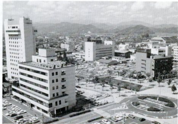
急ピッチで開発が進む駅南地区

鳥取市人づくり・まちづくり基金運営委員会は、21世紀を展望した鳥取市のまちづくりを建設的に具体的なもの