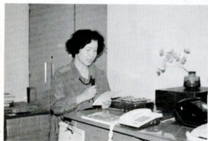
提供情報を録音する担当者。