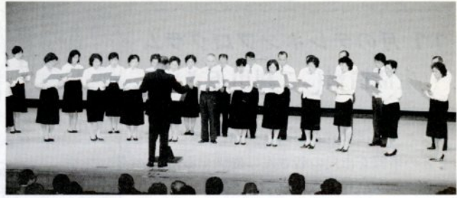
公民館職員のみでオープニング(去年11月)