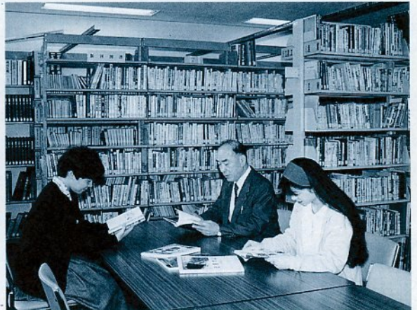
貸し出しも行う中央公民館の図書室

福祉文化会館(西町2丁目)の改装工事が終わり、中央公民館の図書室が広くなりました。図書室には、文学書を中心に郷土、趣味の本など約1万5000冊を備えています。閲覧場所も広くなりましたので、気軽にご利用下さい。 開館時間は午前8時30分～午後5時(土曜日は正午まで) 祝日、日曜日は閉館します。また、一人2冊まで借りることが出来ます。貸出期間は2週間以内。新しく貸し出しを希望する人は、印鑑を持参して下さい。