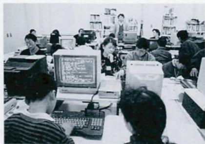
親子でパソコンの基礎を学習

子ども科学館は、パソコンの基礎的な操作の仕方を学習する「初級パソコン教室」を開いています。7月〜8月の教室は次のとおりです。対象 小学6年生20人▽親子15組