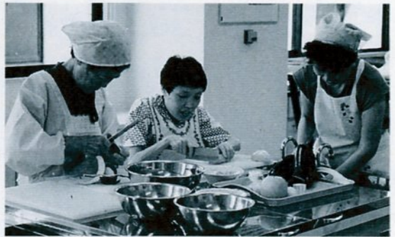
作る——包丁を使い減塩料理に挑戦