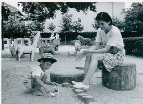
公園で楽しい親子のふれ合い(動物公園で)