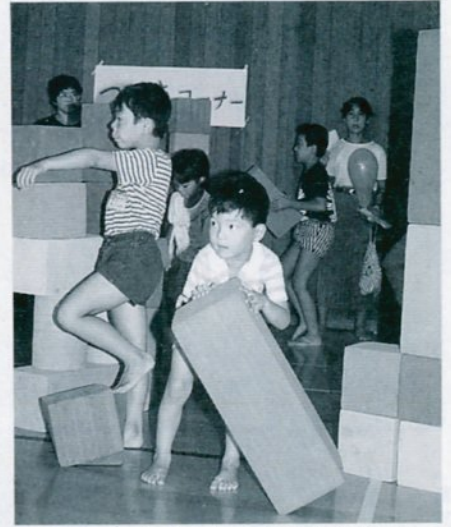
遊びのひろばでブロック積みを楽しむ子供たち(昨年の健康ひろばで)

市民健康ひろば実行委員会は九月一日(日)、市民体育館駐車場を主会場に「第八回市民健康ひろば」を開きます。この「健康ひろば」は、市民同士が交流を深めながら、市民一人ひとりに「自分の健康は、自分でつくる」という意識を高めてもらおうと企画したものです。ちびっ子に人気の高いドラえもんショーや遊びのひろば、ゲートボールの試合など、小さな子供からお年寄りまで楽しめる催しをたくさん準備しています。家族そろってお出かけ下さい。