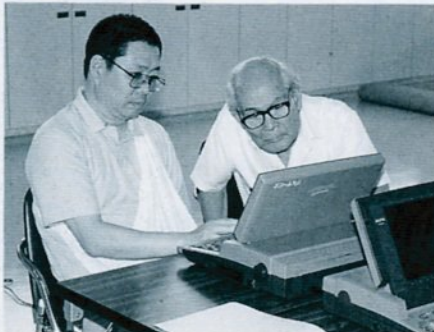
打つ——ワープロの基本操作を学習