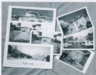
このほど制作した仁風閣の絵はがき

絵はがきセットは、スタンダードタイプ（8枚組み・700円）と横長のイメータイプ（7枚組み・950円）の二種類。雪景色や青空をバックにした四季折々の仁風閣、館内のえっ見の間などをカラーで紹介しています。