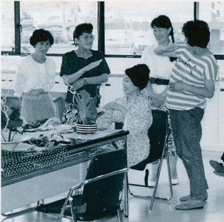
飾る——手話を交じえながら生け花を受講