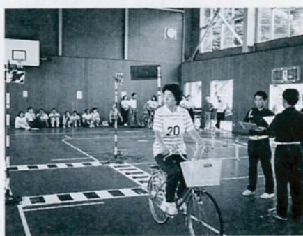
真剣な表情で実技テストを受けるお母さん