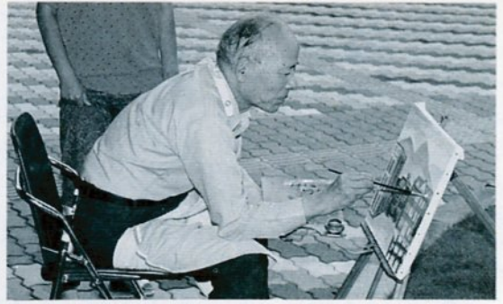
描く——油絵講習で風景画を描写

参加者の一人が「楽しみたいものは、動かない体と心を動かしてくれるのですね」と言われた言葉が私の心に深く残っています。独りでは、外出できない方々がふれあいを通して、一つでも多くの『よかった探し』をしていただき、夢をもって、より楽しく生きる喜びをつくっていただけるよう、これからもお手伝いをしたいと思います。