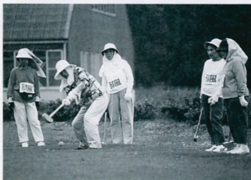
グラウンドゴルフを楽しむお年寄り

しかし、一般的にお年寄りや年齢とともに社会とのつながりが薄れ、社会や家庭中での役割が少なくなりがちです。その結果、生きる目的を見失ってしまふ例も少なくありません。 長くなった老後の人生を健康に過ごし、いかに生きがいのあるものにしていくか。これは、お年寄りだけの問題でなく社会全体の大きな課題であると