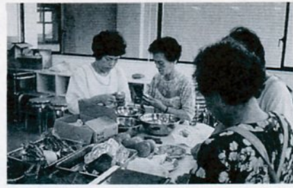
糖尿食の料理講習に取り組む婦人たち