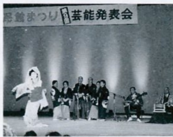
芸能発表会で日ごろの成果を披露

伝承芸能などを発表します。 多数ご来場下さい。(無料) 【作品展示会】 とき 11月15日(金)～18日 (月)午前9時～午後5時 ところ 福祉文化会館4階 【芸能発表会】 とき 11月17日(日)午後1