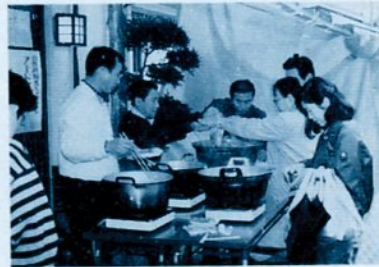
旅館提供の料理を買う観光客たち

また、買い物をした人には、湯質日本一の吉岡温泉無料開放(入浴券)をプレゼントします。 とき 11月17日(日)午前11時～午後2時 ところ 吉岡温泉町地内 問い合わせは、吉岡温泉旅館組合(☎5710311)へ。