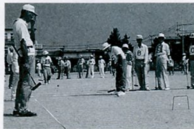
美保公園でゲートボールを楽しむ