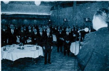
一堂に集い新年を祝う出席者たち(1月1日)

タニ鳥取(今町2丁目) なお、期日までに申し込んだ人の出席者名簿を作成し、参加者に配布して名刺交換に代えます。