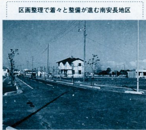
保留地の所在・地積・公売価格

鳥取都市計画事業南安長土地区画整理事業区域内の保留地(宅地)8区画を公開抽選で公売します。面積と公売価格は左表のとおりです。申し込みは、12月2日(月)前10時から市役所第2庁舎5階で行います。