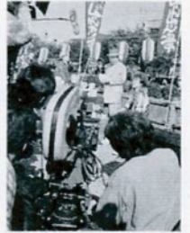
寅さんを演じる渥美み

鳥取市人づくり・まちづくり基金運営委員会は、私のまち写真コンテストに応募された全作品(52点)を市役所玄関ホールに展示します。期間は12月2日(月)～7日(土)。多数ご覧下さい。