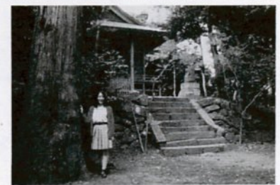
観察会コースの徳尾の森にある神社

鳥取市の恵まれた自然を市民の皆さんに知ってもらうため、市指定保存樹木(名木・古木)や天然記念物に指定された神社の森などを観察します。定員は20人でマイクロバスで回ります。 【とき】6月2日(火)【集合】市役所・午前8時50分【コース】市役所発・午前9時～河内神社、徳尾の森など10カ所程度観察し市役所着・午後3時30分。昼食は見学を兼ねて神谷清掃工場です。 【費用】1000円(昼食代など)【申し込み】往復はがきで、①氏名②連絡先(住所、電話番号)を記入して環境課(市役所内線3141)へ申し込んで下さい。(先着順)