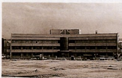
オープンに向け工事が進む「やすらぎ」

入所定員 入所サービス96人 短期入所サービス (14日以内の入所) 4人 通所サービス (日帰り) 10人 利用料 食費、日用品など