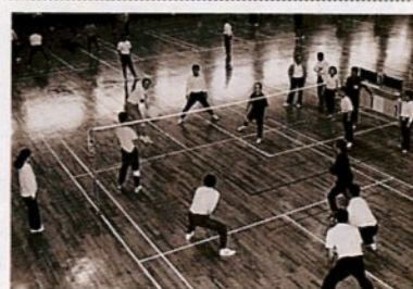
ビーチボールバレーの参加者(昨年)

スポーツに親しみ、市民同士の交流を深める「第3回スポーツレクリエーション祭」が、6月7日(日)市民体育館をメイン会場に開かれます。市民の多数の参加をお願いします。競技はゲートボール、グラウンドゴルフ、ビーチボールバレー、綱引き、ウォークラリー、歩こう会、ラージボール卓球、健康体操教室の