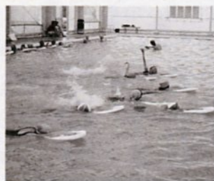
プールで泳ぐ子どもたち

国民年金は、日本国内に住むすべての人を対象に老齢、障害、死亡(遺族)について年金を支給し、健全な生活の維持、向上を図ることを目的とした制度です。