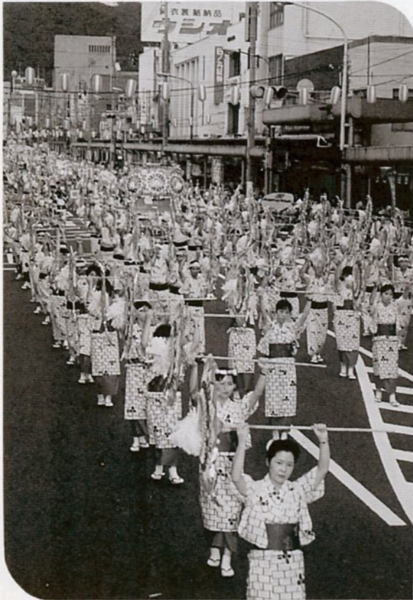
過去最高の67連、3,500人が参加。華やかに一斉踊りを繰り広げました。

「第28回鳥取しゃんしゃん祭」が8月16日、若桜街道、智頭街道などの目抜き通りで華やかに繰り広げられました。