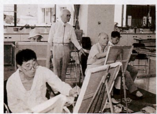
デイサービス事業の一環として油絵を描く

母子家庭の自立を援助するため、厚生課（☎内線2411）＝児童福祉の事業、高齢者福祉課（☎内線2461）＝高齢者福祉の事業、福祉事務所（☎内線2471）＝心身障害者福祉の事業および母子福祉の事業へ。