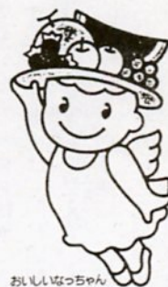
おいしいばっちゃん