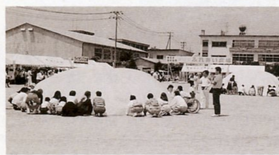
障害者ふれあい広場でゲームを楽しむ

母子家庭の自立を援助するため、厚生課（☎内線2411）＝児童福祉の事業、高齢者福祉課（☎内線2461）＝高齢者福祉の事業、福祉事務所（☎内線2471）＝心身障害者福祉の事業および母子福祉の事業へ。