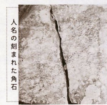
人名の刻まれた角石

まれ変わりました。さて、発見されたお左近の手足鉢ですが、三階櫓のどこに積み込まれていたものか正確な資料が市にはありませんでした。このため広く市民の方に協力をお願いしたところ、一枚の古い写真の提供を受けることができました。