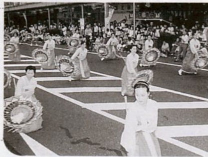
姉妹都市の韓国・清州市からも応援参加