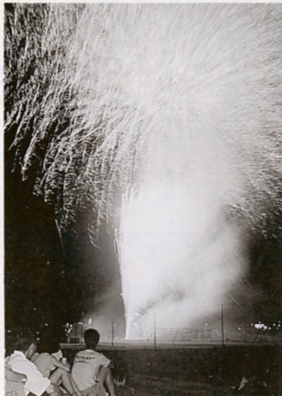
真夏の夜空に 7,000発（市民納涼花火大会）