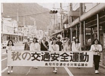
若桜街道をパレード（昨年）

また、鳥取市交通安全対策協議会などの主催で9月28日（月）午後1時30分から4時まで、文化ホールで「鳥取地区交通安全大会」を開催します。