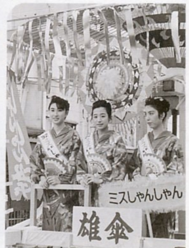
市中パレードに花を添えるミスしゃんしゃん娘たち