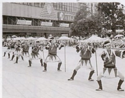
駅前風紋広場で行われたしゃんしゃん自由踊り