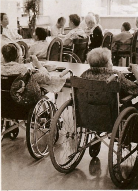
老人施設での昼食のひとつ

寝たきり老人や虚弱老人を介護している家族の人が病氣、冠 婚葬祭、出張、看護疲れなどで介護ができなくなったとき、老人ホームでお世話をします。 〈入所期間〉七日以内。ただ