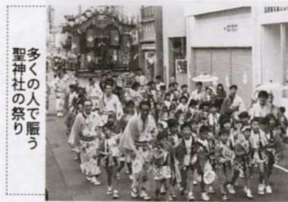
多くの人で賑う 神社の祭り

写真のテーマ：鳥取市内で開催される祭りや行事、イベントなどを対象とし、鳥取のにぎわいをアピールするもので、題材は自由。 募集期間：8月3日（月）～10月30日（金）