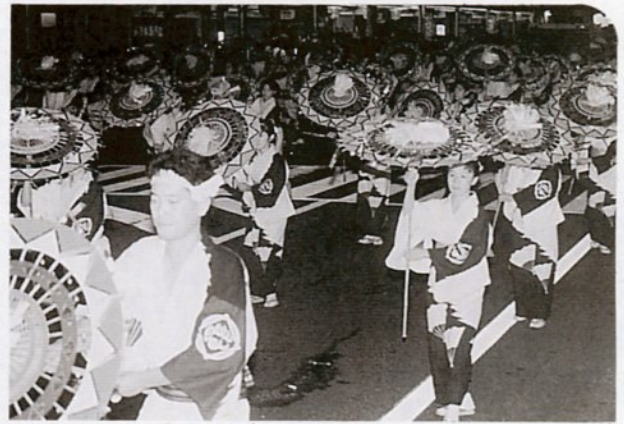
メインストリート「若桜街道」で踊りも最高潮

メインストリートで午後6時から始まった一斉踊りには過去最高の67連、3,500人の踊り子が出場し、沿道には約16万人の市民や観光客が詰めかけ、軽やかな鈴の音と華麗な踊りに拍手を送っていました。