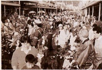
昨年の木のまつり(若桜街道)