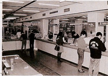
市役所本庁の市民課窓口

戸籍手数料令の改正があり、戸籍簿・抄本などの交付手数料が、平成5年1月1日から下表のとおり変わります。問い合わせは、市民課(☎市役所内線2431)へ。