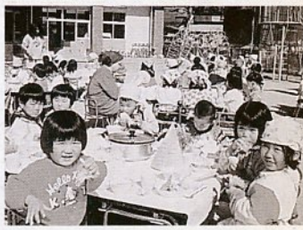
青空の下で食事 (わかば保育所)

市内にある保育所が、平成5年度入所希望の園児を受け付けています。受付期間は、12月1日(火)～22日(火)。入所を希望する保育所へ入所申請書を受け取り、申し込んで下さい。