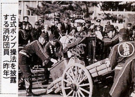
古式ポンプ操作を披露する消防団員(昨年)

「ミスちゃんしゃん娘」を一日消防団長に招き、次の日程で恒例の市消防出初め式を行います。ま