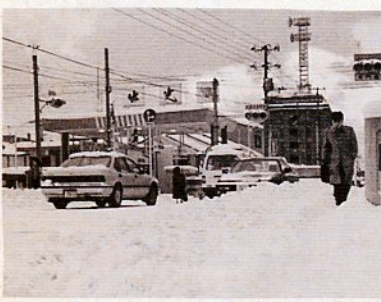
積雪時の路上駐車はやめよう

場所に変更して、持ち出して下さい。し尿のくみ取りについては、収集日が近づいたら道路から便槽までの除雪をお願いします。