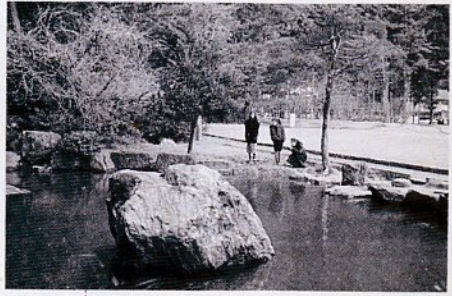
多くの市民が憩う 橋谿公園

美しい自然と環境に恵まれた鳥取市を見つける「写真コンテスト」の作品を募集します。本市を都と呼ぶにふさわしい、ゆとりと優美さを感じさせる風景や史跡、名勝、民俗芸能などを写真で表現して下さい。