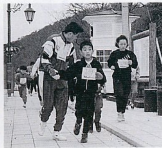
お父さんと一緒に