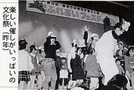
楽しい催しがいっぱい 文化祭(昨年)

市立病院は、次の日程で糖尿病料理講習会を開きます。 とき 3月4日(木)午前9時30分～午後1時 ところ ささづか会館 定員 20人 費用 500円(当日持参) 内容 栄養士による食事療法の基本についての講義と調理実習など 申し込み、問い合わせは市立病院給食係(☎23-6211・内線328)へ。