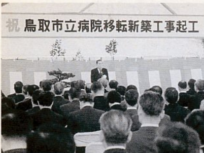
起工式であいさつをする西尾市長