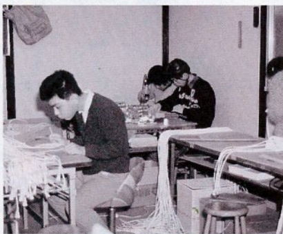
電器部品作業 (福祉作業所かめの会で)

今後、作業所に適した仕事があれば、お願いすることを検討したり、所生の増員等について相談、助言をするなど努力していきたい。