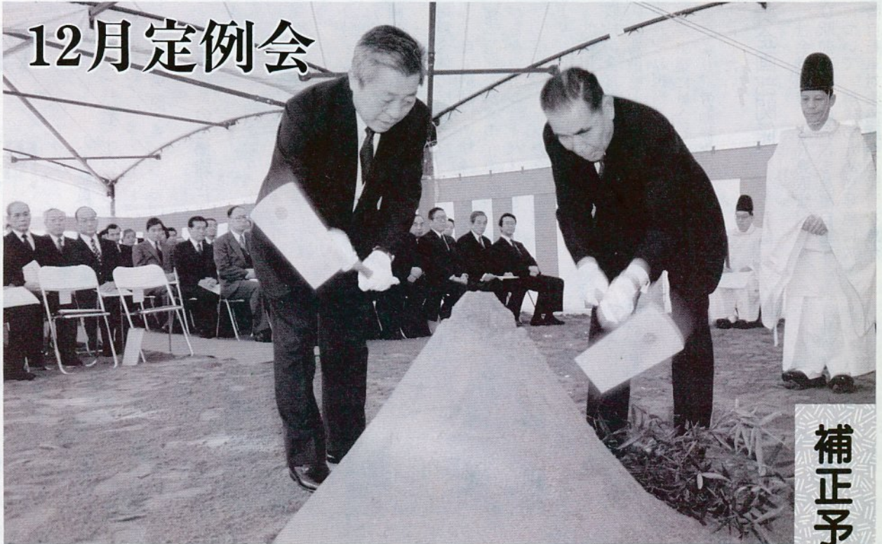
平成七年四月オープンに向けて着工 市立病院のくわ入れ式(一月十二日)