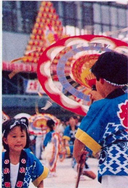
可愛らしい、しゃんしゃん傘踊りのひとこまです。

キャプテンとっとりでは、16日からのだいせん国体の競技結果を速報でお知らせします。見てね。