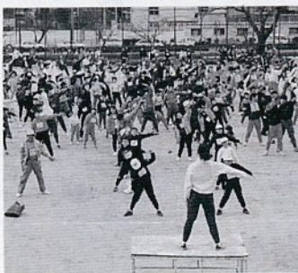
ラジオ体操で体をほぐす参加者