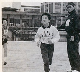
ゴールまであとひと息