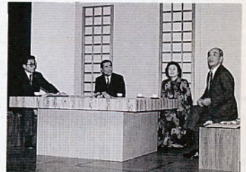
炉端談義の風景 (昨年)

内容 講演▽炉端談義ほか 申し込み、問い合わせは農林水産課(☎市役所内線2623)へ。