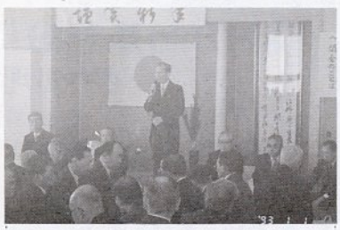
西尾県知事のあいさつ

1993年の元旦は近年にない好天で明けました。美保地区の行事は、年頭の新年互礼会で始まります。互礼会は美保讃歌の斉唱で始まり、地区会長、地元出身の議員代表のあいさつ。そして地区内の各界各層の