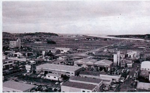
鳥取港背後地の賀露・南隈・晩稲地区(手前は区画整理後の千代水一、三丁目)

市長 国は、河川内のプレジャーボートの無断係留を禁止する等を目的とする、河川法の改正を近く行うと聞いている。今後、県もマリナー整備等について検討されると聞いており、本市としても、通称「重箱」地区を具体的な設置場所候補の一つとして、関係機関と協議をし、協力して問題解決に向けていきたい。