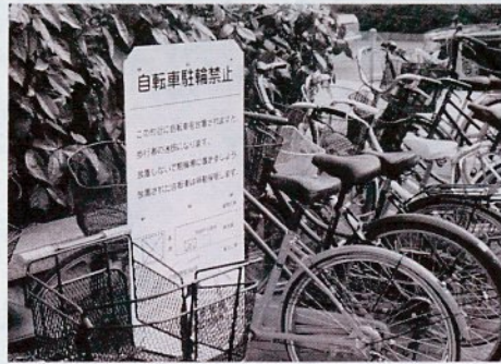
J R鳥取駅前の放置自転車

市長 道路管理者、商店街の組合、JR、学校関係者、市民代表者等を構成員とした協議会の設置を考えており、一月にも開催をして、放置自転車の現状、課題等を踏まえ、これまでの対策等の見直しも含めて話し合いをさせていただく予定である。