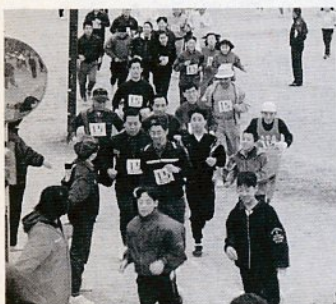
スタートしたばかり、ガンバレ!