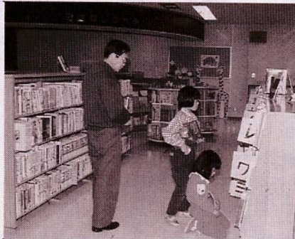
広く利用しやすくなった児童図書室