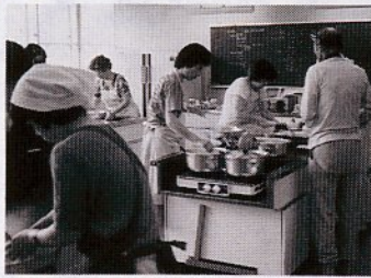
糖尿病の料理講習を受ける皆さん

市立病院は、次の日程で糖尿病料理講習会を開きます。とき 5月20日(木)午前9時30分~午後1時 ところ 22さんか会館 定員 20人 費用 5000円(当日持参) 内容 栄養士による食事療法の基本についての講義と調理実習など 申し込み、問い合わせは市