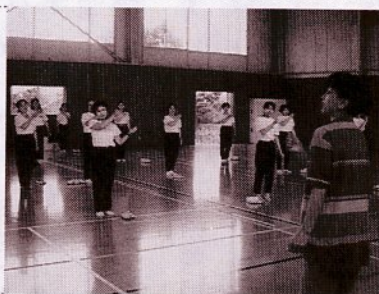
今年のスポ・レク祭で行なわれた健康体操教室

スポーツに親しみ、市民同志の交流を深める「第4回スポーツレクリエーション祭」を6月6日(日)、市民体育館を主会場に開催します。市民の多数の参加をお願いします。