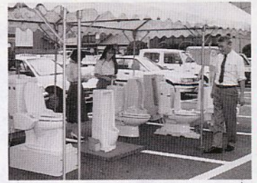
水洗用具の展示(昨年)