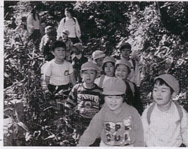
楽しい遠足 (倉田保育所)

市内にある保育所が、平成6年度入所希望の園児を受け付けています。受付期間は、12月1日(水)~22日(水)。入所を希望する保育所へ入所申請書を受け取り、申し込んで下さい。