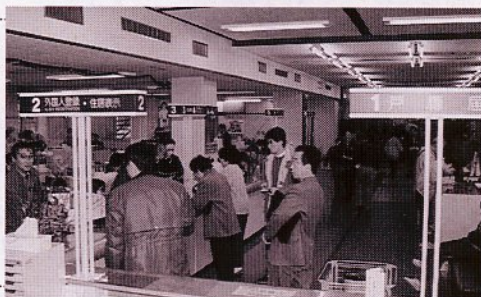
市役所本庁の市民課窓口