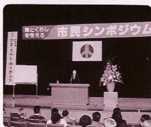
昨年のシンポジウムの様子

私たちの主食である「コメ」は、現在、国際化の波が押し寄せています。コメをテーマに次の日程で、農とくらしを考えるシンポジウムを開催します。来場者先着500人にコメを差し上げるほか、コメ10キロが当たる抽選会も