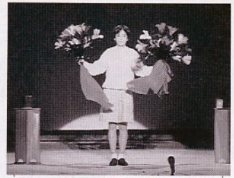
日ごろの学習成果を披露 (昨年のマジックショー)

文化センター展示発表会を次の日程で開きます。こども科学館で学習した各教室の1年間の成果を発表します。入場は無料。多数ご来場下さい。【ステージの部】マジック教室生徒のマジックショーと人形劇団こうま座の影絵