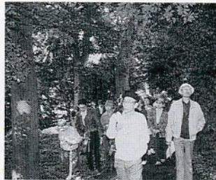
昨年の観察会の様子

鳥取市の恵まれた自然を市民の皆さんに知っていただくため、市指定保存樹木（名木・古木）や天然記念物に指定された神社の森などを観察します。定員は20人で、マイクバスで回ります。ときⅡ6月1日（水）コースⅡ市役所集合・午前8時50分～出発・午前9時～河内神社、徳尾の森など10カ