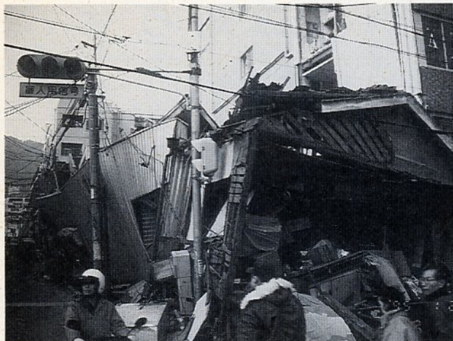
多くの犠牲者を出した阪神大震災のきずあと (神戸市灘区内で撮影)

大地震による被害を最小限にできるかどうかは、日ごろの備えとその瞬間に適切な行動がとれるかどうかにかかっています。もしものときに備えて防災対策をあらためて見直しましょう。