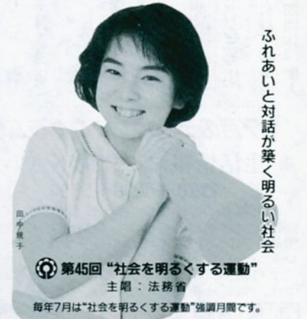
ふれあいと対話が築く明るい社会

第45回「社会を明るくする運動」 主唱：法務省 毎年7月は「社会を明るくする運動」強調月間です。