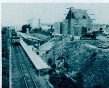
建設が進む鳥取大学前駅

開業により、皆さんの交通の利便が増すこととされます。進んで公共交通機関を利用しましょう。