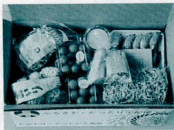
四季折々に届けます

鳥取でとれた新鮮な農林水産物、手づくりの加工品などの詰め合わせを送る「ふるさととっとり宅配便」の申し込みを受け付けています。とれたての野菜や果物、無