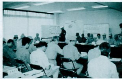
市役所庁舎に設置された本部