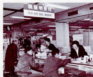
市民税課軽自動車窓口

院医療費の公費負担が記載されているもの) 自動車検査証 自動車運転免許証 軽自動車税納税通知書 なお、減免については障害の部位や程度により制限があります。 詳しくは市民税課(本市役所内線2213)へ。