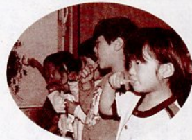
食べたら磨く習慣を！ (むつみ保育園)

周病で、第二位は虫歯です。どちらも痛みなどの自覚症状がでてきたときは、かなり進んでいます。定期的に歯科検診を受け、異常を早期発見して治療を受けましょう。