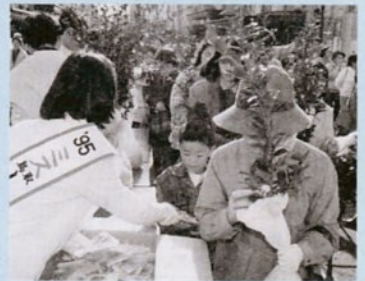
苗木のプレゼントもあります。