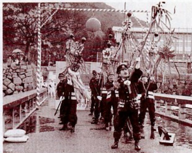
消防団によるまといの演技

ミスちゃんしゃん娘を一日消防団長に招き、次の日程で新春恒例の消防出初め式を行います。