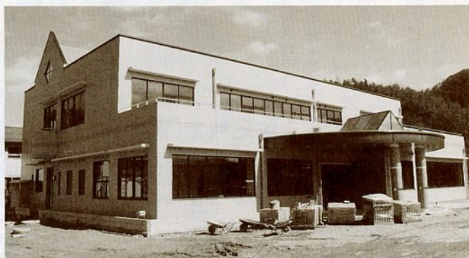
建設された鳥取市東デイサービスセンター