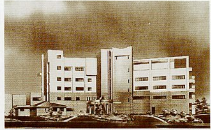
完成がたのしみ(完成予想図)

このたび、大樹荘は、高齢者はもとより、家族連れや観光客などにも幅広く利用していただくため、全面改築により、新しく生まれ変わります。