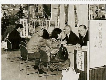
お気軽にご相談を!

税を知る週間(11月11日 17日)にちなみ11月11日(火) から、市内パレードをはじめ