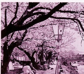
多くの市民でにぎわう桜まつり

4月7日(火)まで久松公園、お堀端、旧袋川堤防、天神川流域で恒例の桜まつりを行って