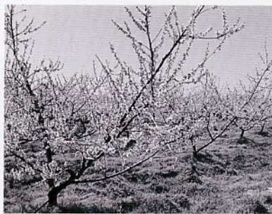
辺り一面に咲き乱れる桃の花

県内唯一のモモの生産地・神戸地区。衣笠果樹生産組合は、満開のモモの花を市民のみならずにも楽しんでいただくとうと花