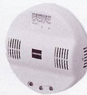
壁掛型CZ-173A 天井直付型CZ-273A