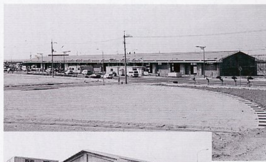
このたび完成した荷さばき所

り、すでに荷さばき所など一部施設が完成しました。これにより、平成11年度からは鳥取港西浜地区に県東中部の水産物が集荷され、新たな生産・流通拠点ができます。