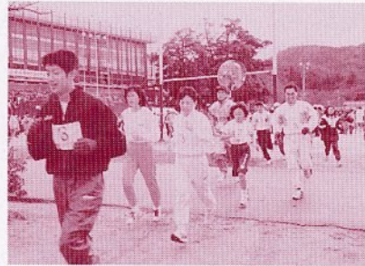
力走する参加者のみなさん