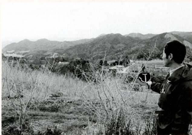
家族で長年かけて切り開いてきた農場「ここからは市街地や湖山池も見渡せ、ながめは最高、妻もお気に入りです。」

農業はやればやっただけの成果がかえってきます。梨づくりも収穫までにはいろいろな作業がありますが、どの作業も手を抜かず確実にやっていたら、それだけのものができるんです。それに、なんといっても農業は家族が同じ目的を持って一緒に喜び、がんばることができ点がすばらしいと思っんです。