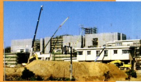
急ピッチで建設の進む大学校舎

鳥取環境大学は、平成十二年十二月二十一日、文部大臣から大学設置の認可を受けました。 昭和四十七年の第一次総合開発計画に「女子短期大学の誘致」が位置づけられてから、市政の重要課題として取り組みが継続され、平成九年三月には、鳥取県と鳥取市が新大学の設立に取り組むこととなりました。 その後、平成十一年九月に文部省に大学設置認可を申請し、面接審査、実地審査等を経て、今回の認可となりました。 市民の長年の願いであった鳥取環境大学が、平成十三年四月に開学します。