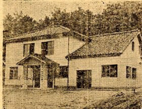
木の香も新しい松保公民館