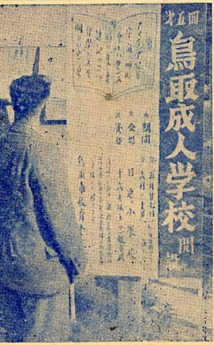
鳥取成人学校開校式

盛大な開校式 去る5月26日午後5時 30分より日進小学校で待 望の開校式が催された。 その次第左の通り ①開校式次第 イ、開式の言葉 ロ、学校長挨拶 ハ、来賓祝辞 ニ、講師紹介 ホ、講師代表挨拶 ヘ、閉式の言葉 ②記念音楽会 鳥取放送合唱団(指揮 小畑義之) 伴奏太中貞枝 による「山寺の和尚さ 時の焦点」 ハ、運営委員選出 ③運営委員会 イ、自己紹介 ロ、学級運営について 協議の結果第一回運 営委員会を来る6月 7日に開くことを決 定して解散した。 なお、科目別受講生は 次の通り。 ◎Aコース 六四名 アマチュア写真 二〇〇 宇宙の神秘 七〇〇 哲学と人生 七〇〇 ◎Bコース 三八名