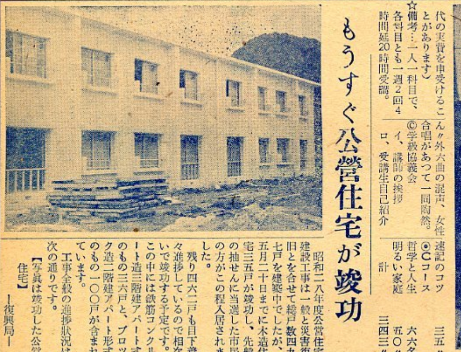
もうすぐ公営住宅が竣工

昭和二八年年度公営住宅 建設工事は一般と災害復 旧とを合せて総戸数四九 七戸を建築中でしたが、 五月二十日までに木造住 宅三五戸が竣工し、先般 の抽せんによって入居され ました。 残り四六二戸も目下着 々進捗しているので相次 いで竣工する予定です。 この中には鉄筋コンクリ ート造三階建アパート式 のもの三六戸と、プロツ ク造二階建アパート形式 のもの一〇〇戸が含まれ ています。 工事全般の進捗状況は 次の通りです。 【写真は竣工した公営 住宅】 一復興局一