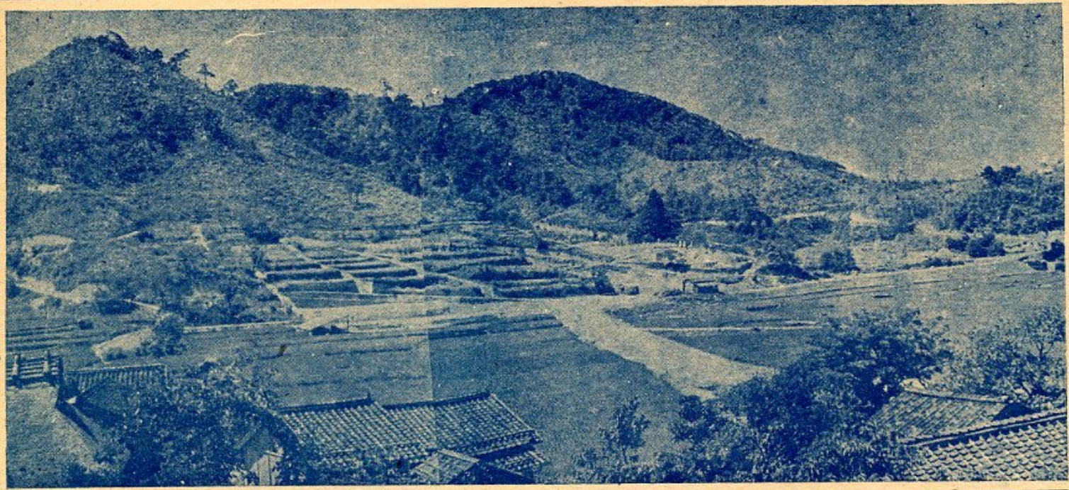
〔円護寺より公園墓地を望む〕