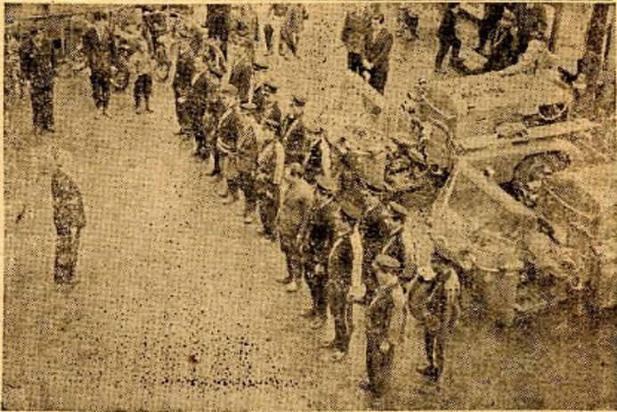
鳥取市では、火災警報から、一層火の元に御注...