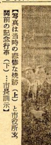
写真は当時の悲惨な焼跡(上)と市役所支庁前の記念行事(下)。(市長訓示)