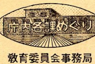
教育委員会事務局