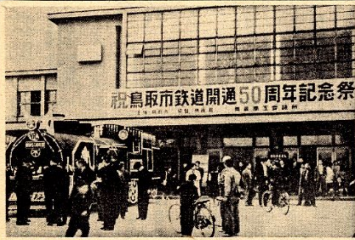
祝鳥取市鉄道開通50周年記念祭

鳥取市は足利末期に城18年の大震災、更に昭和27年4月の大火と、相次いで大震災に見舞われ、明治40年4月、その都度市の大半を焼失した。この三日間鳥取市は、開通を見て、連隊や県庁展、遷喬小学校講堂での設置となり、以来「全国観光ボスター」として、地方文化、産業、交通の拠点として発展して、吉氏による「鳥取市観光」が、不幸昭和